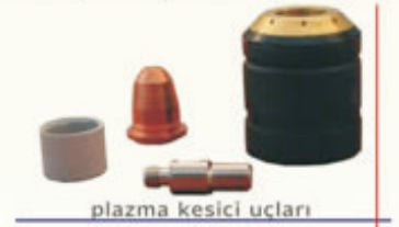
plazma kesici uçları