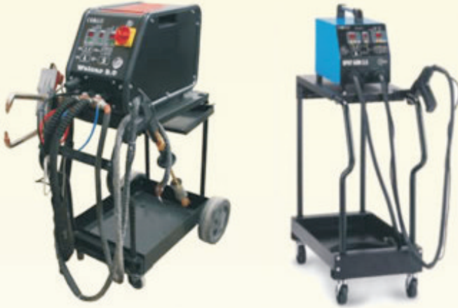
9000A SPOTGUN 3500A

Hasarlı araçlara göçük çekirme, tek taraf punta ve çift çene punta yapılması amacıyla üretilmiş cihazlardır.